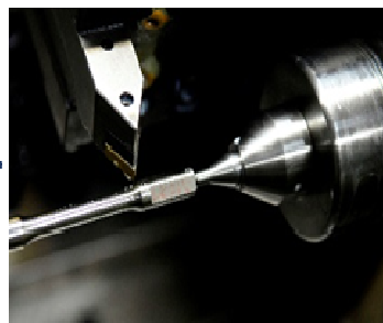
● 機械加工(旋盤作業)