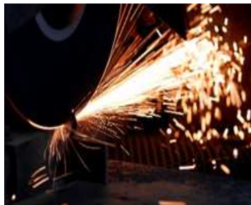
● 割り出し(切断作業)

キグチテクニクスは、試験素材の切り出しから熱処理、試験片の加工、試験評価まで一貫通貫体制による高品質と短納期、低コストで、ものづくり企業を支えています。